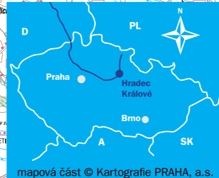
mapová část © Kartografie PRAHA, a.s.