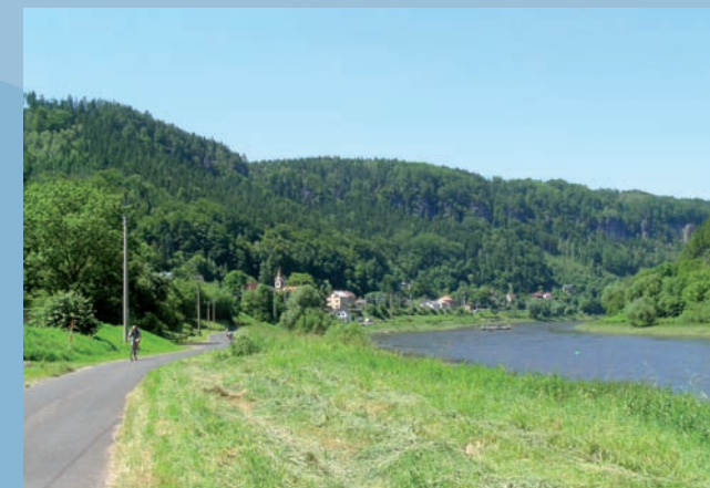
Labská stezka u Pirny