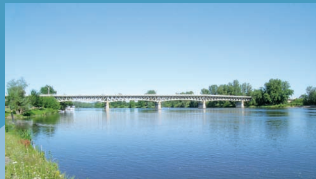
Most u Roudnice nad Labem