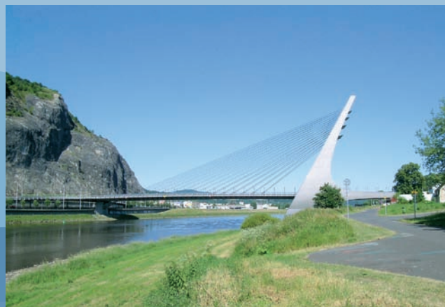
Mariánský most u Ústí nad Labem