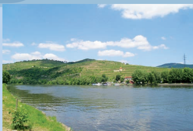
Vinice u Velkých Žernosek

Mírové náměstí 15/7, 412 01 Litoměřice ☎ +420 416 732 440, e-mail: info@litomerice-info.cz