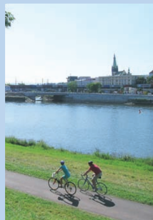
Labská stezka u Ústí n. L.

Z Děčína vede Labská stezka malebným údolím s hrázďenými domy, zámek a pivovarem Velké Březno, historickou železnicí a muzeem lidové architektury v Zubnici. Hluboké a úzké údolí je pouze krátce přerušeno v Ústí nad Labem, centrem regionu, které nabízí svým návštěvníkům kromě hradu Střekova také jedinečnou možnost na vlastní oči sledovat proměnu průmyslového města v moderní centrum obklopené přírodou. Ale to jsme již znovu na nově vybudované cyklostezce a spěcháme poslední částí labského údolí zvanou Porta Bohemica a mezi vinicemi v okolí Velkých Žernosek k jednomu z nejstarších a nejkrásnějších českých měst – do Litoměřic. Královské město a biskupské sídlo Litoměřice vás přivítá nejen řadou kostelů a historických měšťanských domů, ale také každoročním vinobraním a dalekým výhledem z městských hradeb do rovinaté oblasti středních Čech.