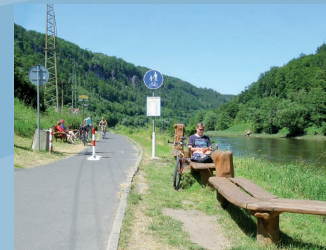
Odpočívka u Dolního Žlebu

Zbrojnická 14, 405 02 Děčín ☎ +420 412 540 014, e-mail: decin@ceskosaske-svycarsko.info