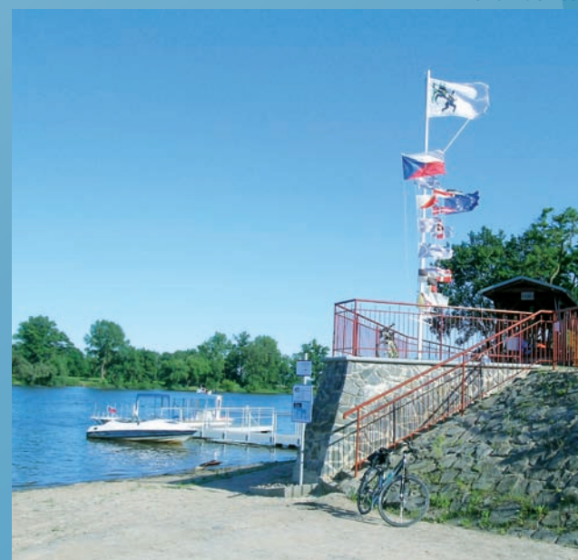
Přivoz u Nučniček