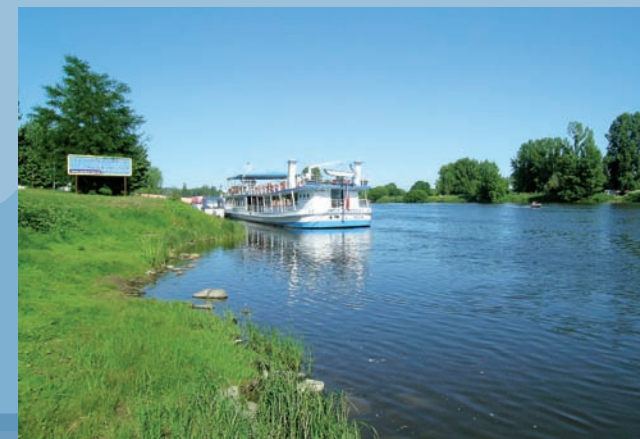
Výletní loď Porta Bohemica

Terezín – barokní pevnost a bývalé židovské ghetto; Roudnice nad Labem – zámek, hora Říp; Račice – závodní veslařský kanál; Štětí – konečná stanice pravidelné vodní dopravy z Litoměřic; Mělník – zámek, vinařství, kostnice, ústí Vltavy.