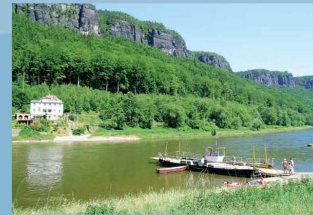
Přivoz u Dolního Žlebu